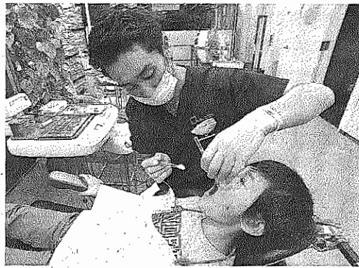
歯髄細胞は良質な幹細胞を多く含む